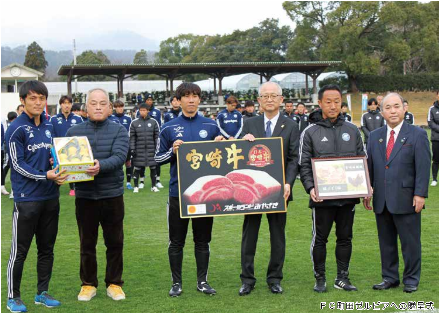
F C町田ゼルビアへの贈呈式